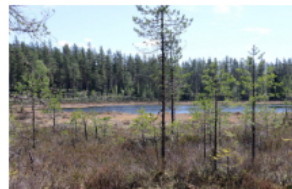
Dödsgröpan vid Skeppundsdaalen är vattenfylld. Här ska det en gång i tiden ha funnits en marknadsplats.