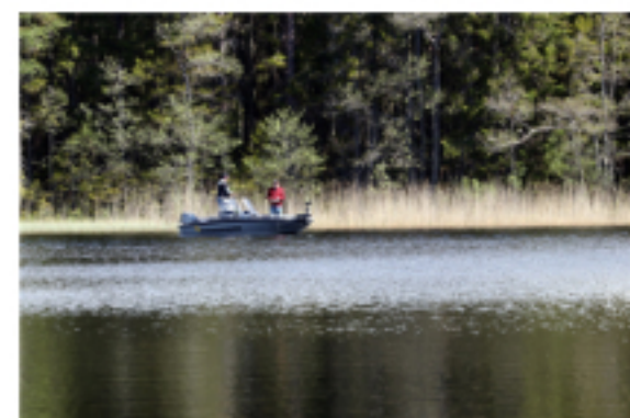
Ute på Alstern är det möjligt att få se en och annan fiskebåt.