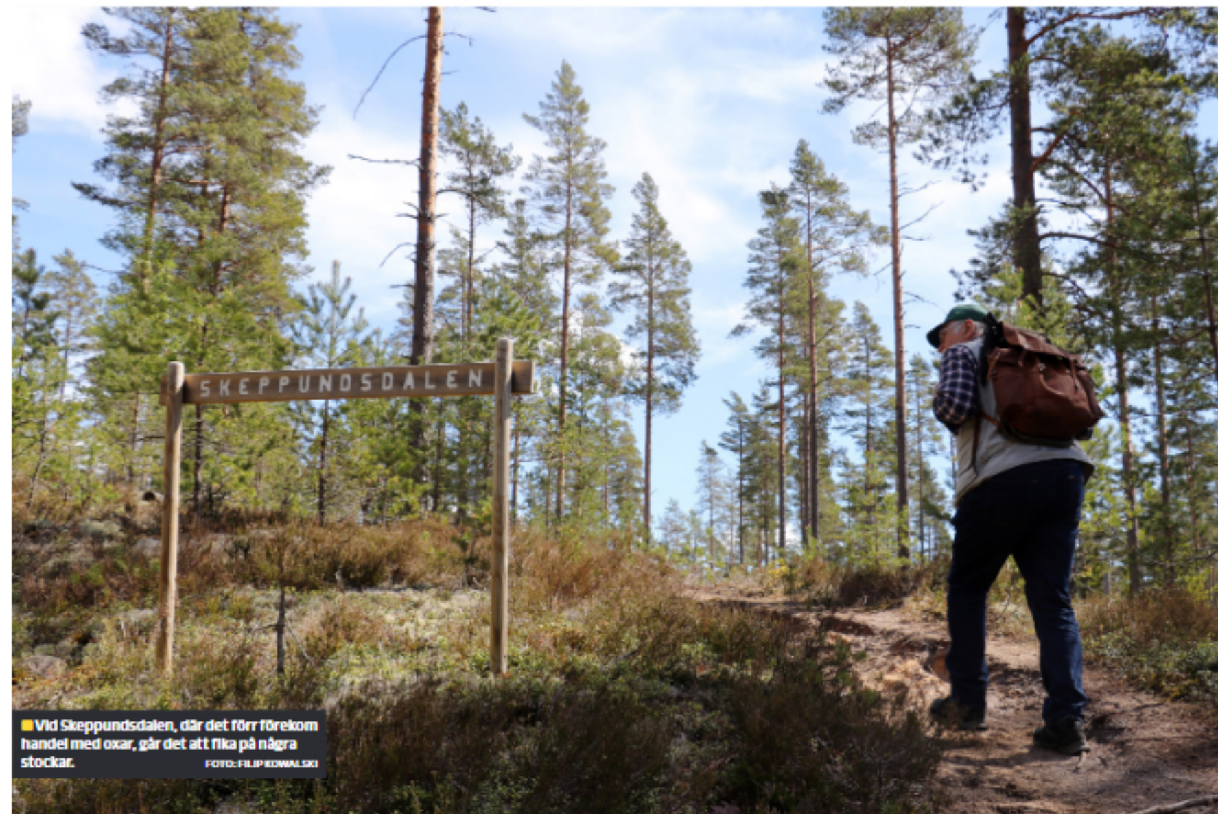
Vid Skeppundsdaalen, där det förr förekom handel med oxar, går det att fika på några stockar.

Filip Kowalski 0590-79 15 57 filip.kowalski@filipstadstidning.se