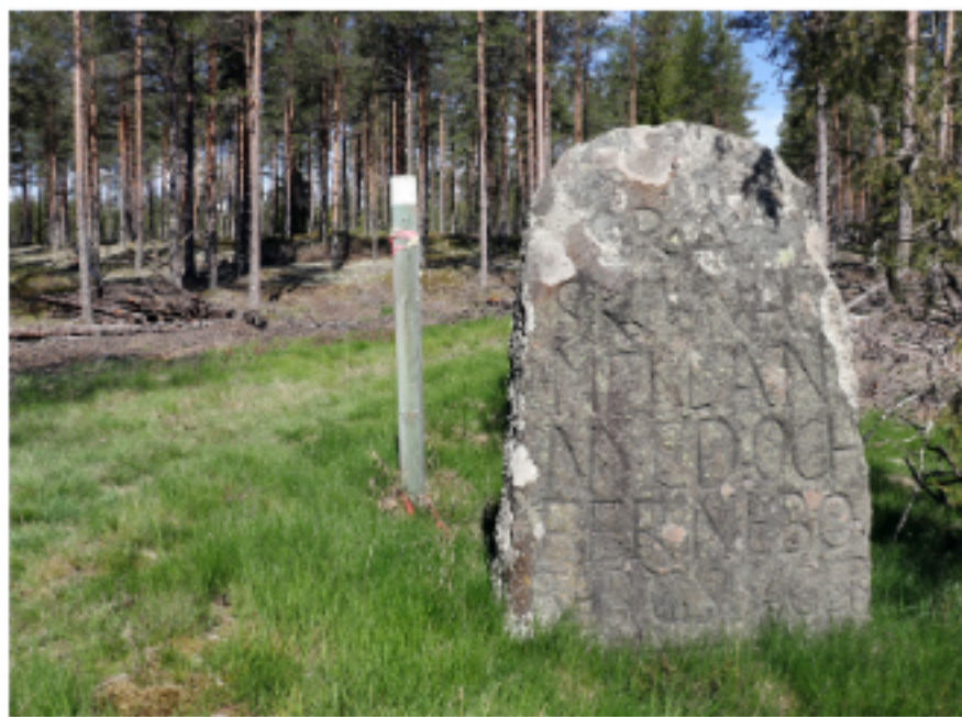
Intill krigsflygfältet gick gränsen mellan Nyeds och Fernebo bergslager.