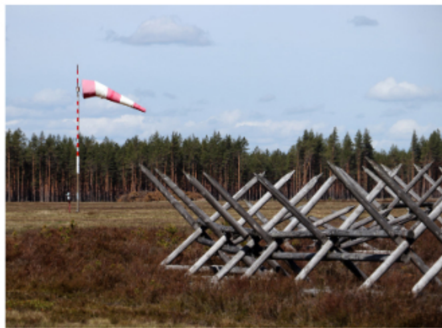
Krigsflygfält 16 påminner om den svenska mobilseringen under andra världskriget.